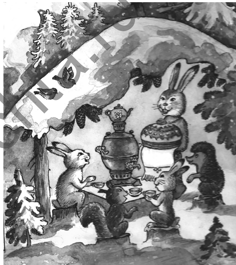
Артовкось В. Федюнинэнь

Ёжов сеель сёксенть малав Эци лопа марнэ алов.